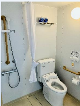
個室 (ユニットバス)